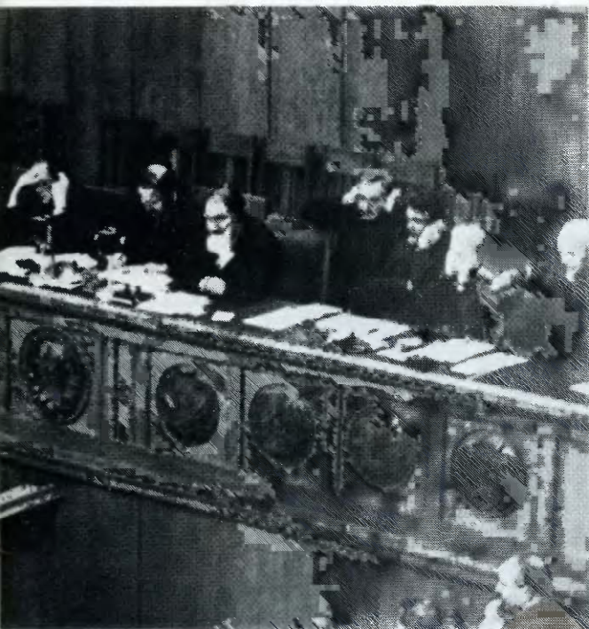
Выступление Сталина на XVII съезде партии. 1934 г.